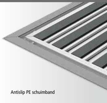
Antislip PE schuimband