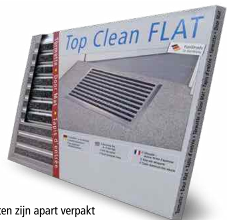
Top Clean FLAT entreematten zijn apart verpakt voor een goede productpresentatie.